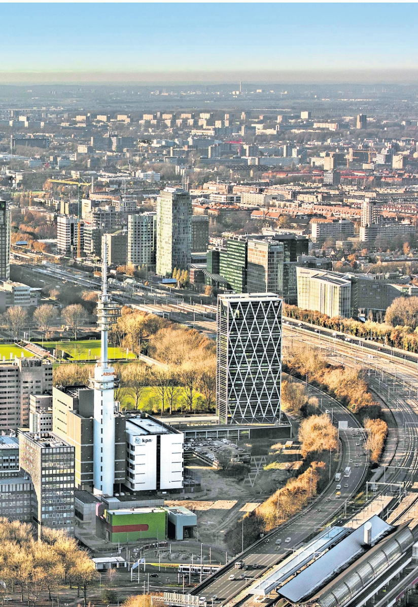
▲ De Zuidas in Amsterdam.

wetenschappelijk instituut zelf een dubieuze rol want één van de bestuursleden van de stichting is bezig met een promotie-onderzoek naar monetaire stelsels aan de Technische Universiteit Delft. Een auteur van een wetenschappelijk proefschrift slingert notabene waar het zijn eigen studiegebied betreft, complete nonsens de wereld in. Een zogenaamd wetenschapper die wegens zijn activistische agenda de objectiviteit volledig uit het oog verliest.